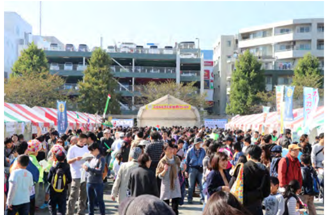
港南区：こうなん子どもゆめワールド