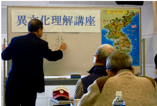
保土ヶ谷区：韓国の魅力～ここがポイント～留学生と語る会