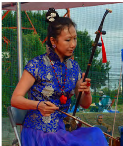
鶴見区：第30回鶴見川サマーフェスティバル2016