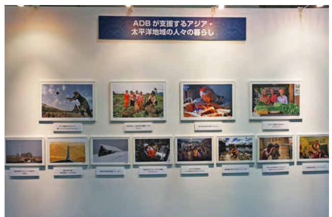
実際に使用したパネル