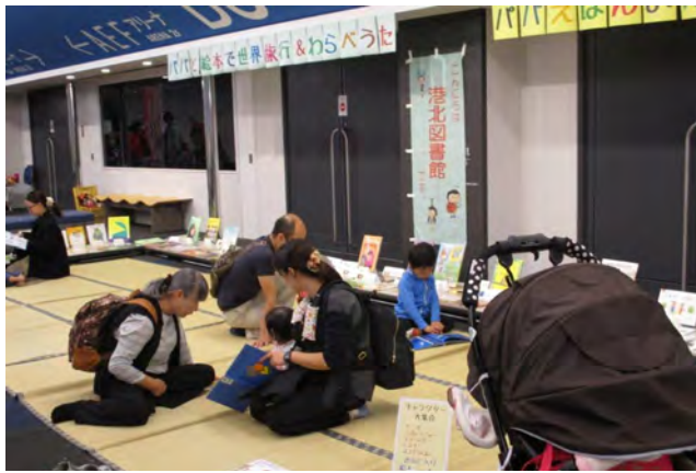
港北区：パパと遊ぶー絵本と工作のワンダーランド