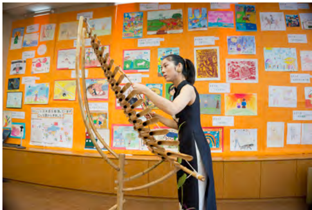
青葉区：第12回区民交流センターまつり