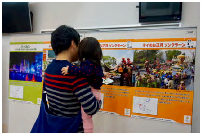
緑区：アジア×みる アジアのお祭りパネル展