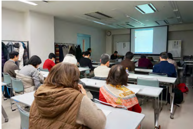
南区：アジアポピュラーミュージック講座