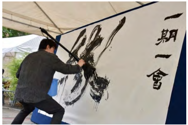
中区：第41回中区民祭り「ハローよこはま2016」