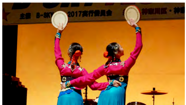
神奈川区：B-SKY FES 2017