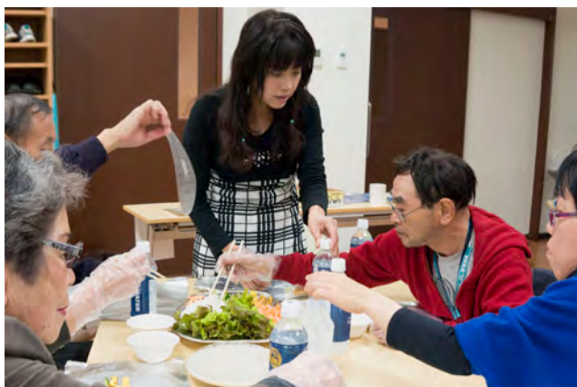
泉区：多文化交流会