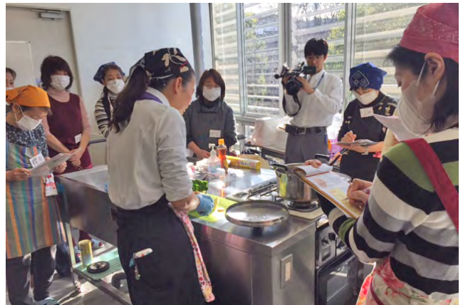
旭区：アジア各国伝統料理 体験教室