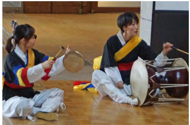
韓国の伝統芸能「農楽」