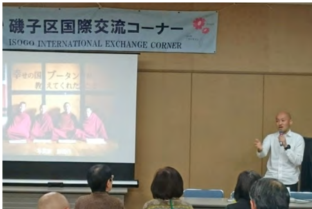
磯子区：国際交流プチサロン