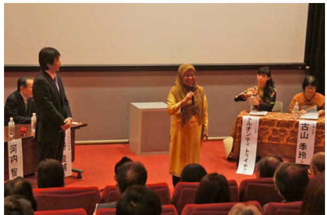
栄区：江戸×アジア文化から学ぶ究極エコライフ