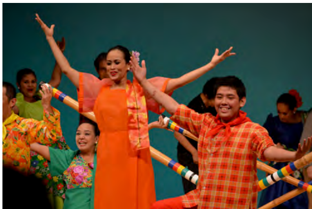
戸塚区：アジア音楽と舞踊の旅コンサート