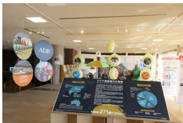
ADBの歴史や事業の紹介