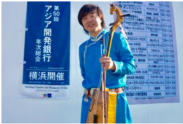
西区：第41回西区民まつり