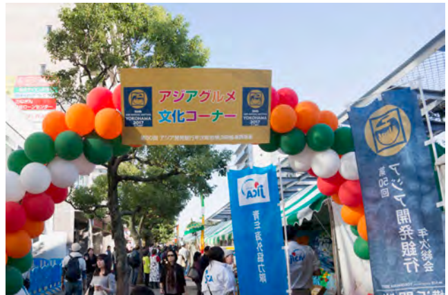
都筑区：第22回都筑区民まつり