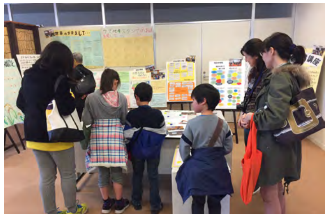
市内小・中学校での国際理解講座の成果展示