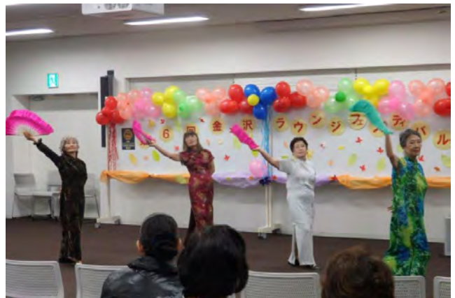
金沢区：第6回金沢ラウンジフェスティバル