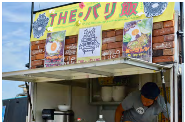
瀬谷区：アジアめしフェス