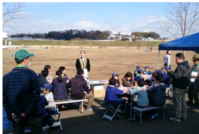
凧揚げイベントでのクイズ大会