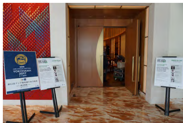
HEARD ON THE STREET LIVE会場