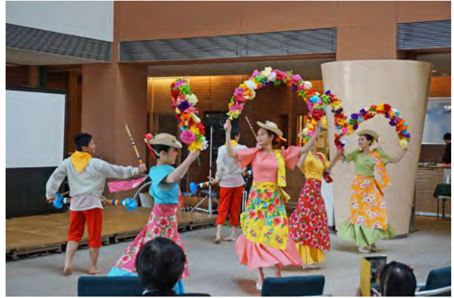
フィリピンの舞踊

※JICA横浜1階、2階において「ADB×JICA横浜～国際協力のミライ 見て、さわって、体験してみよう、国際協力!」を同時開催(前ページ参照)